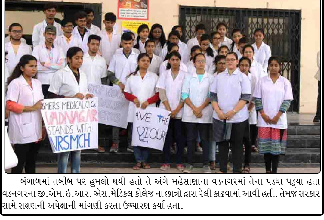
બંગાળમાં તબીબ પર હુમલો થયો હતો તે અંગે મહેસાણાના વડનગરમાં તેના પડઘા પડ્યા હતા વડનગરના જી.એમ.ઈ.આર. એસ. મેડિકલ કોલેજ ના છાત્રો દ્વારા રેલી કાઢવામાં આવી હતી. તેમજ સરકાર સામે સક્ષણની અપેક્ષાની માંગણી કરતા ઉચ્ચારણ કર્યા હતા.